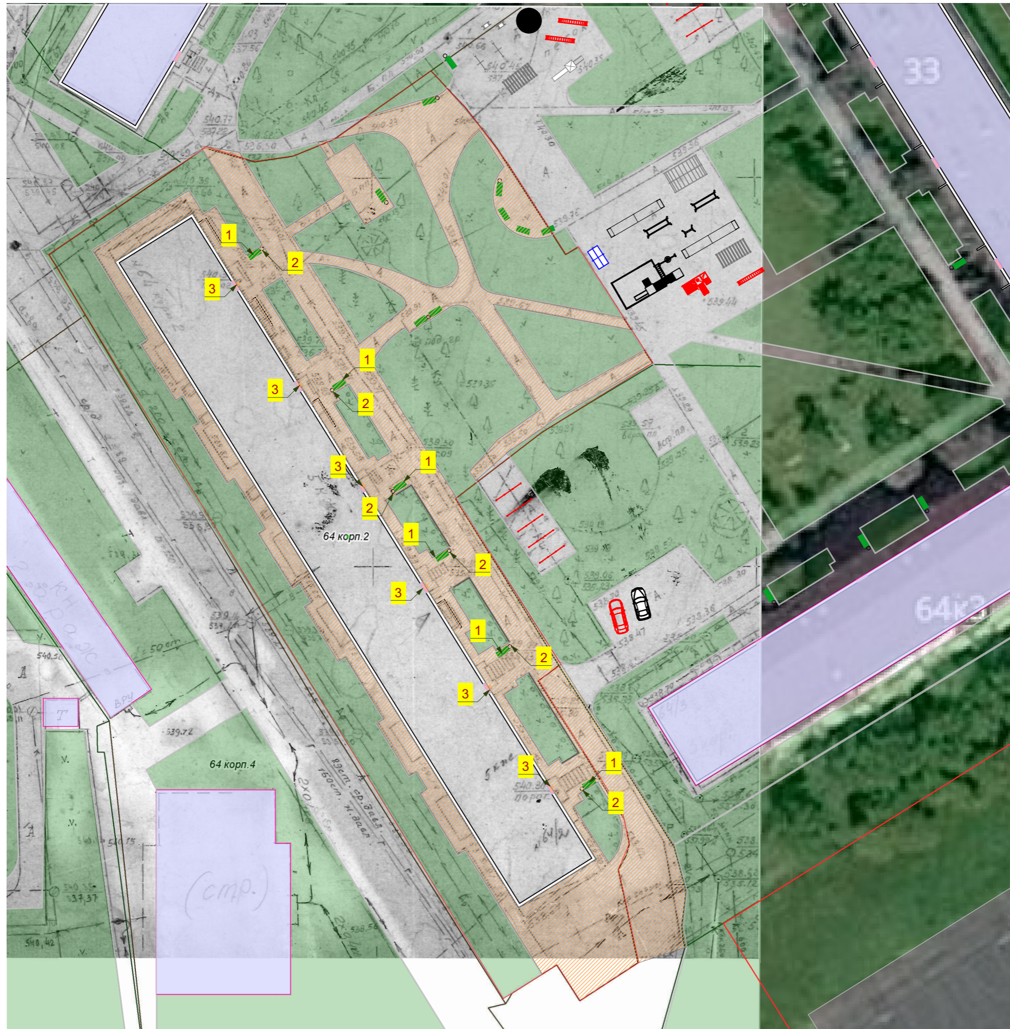
Схема благоустройства. М1:500. (1)