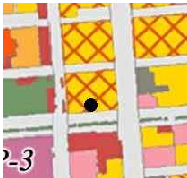
Фрагмент карты градостроительного зонирования территории муниципального образования города-курорта Пятигорска