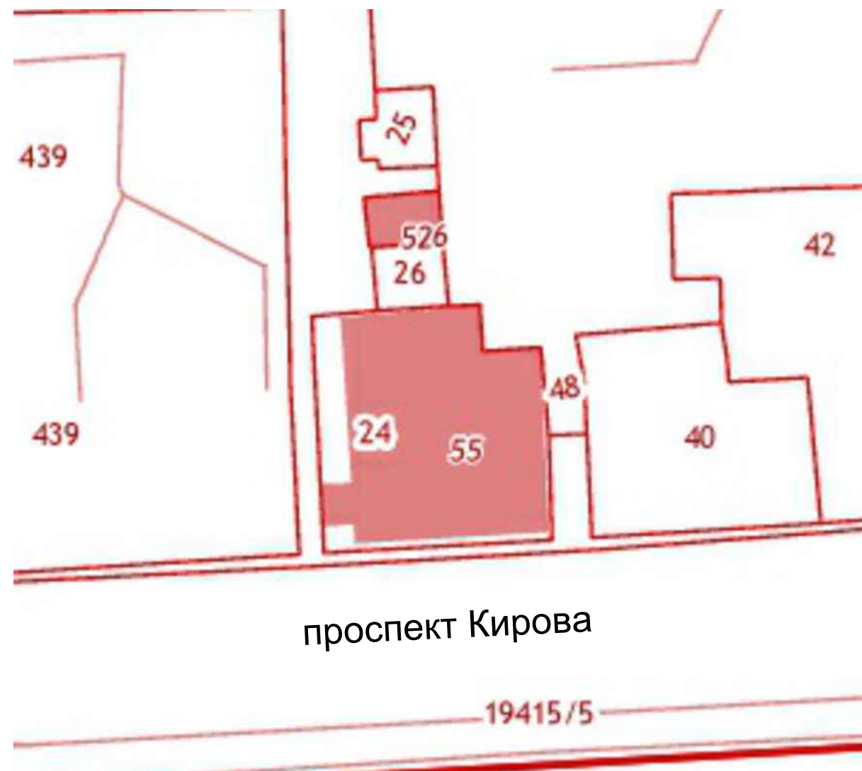
Фрагмент карты градостроительного зонирования территории муниципального образования города-курорта Пятигорска